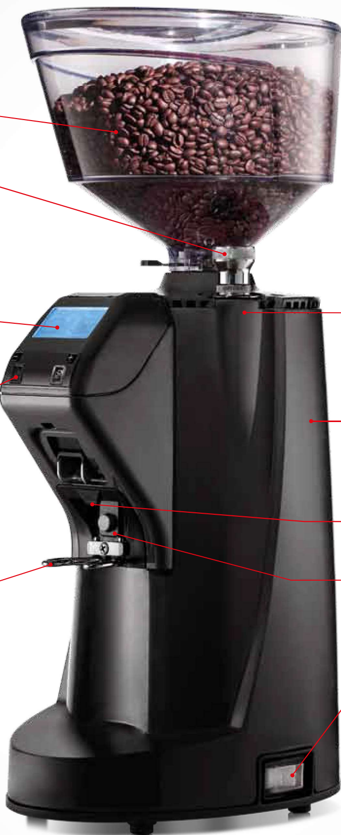
Versione nero Black version